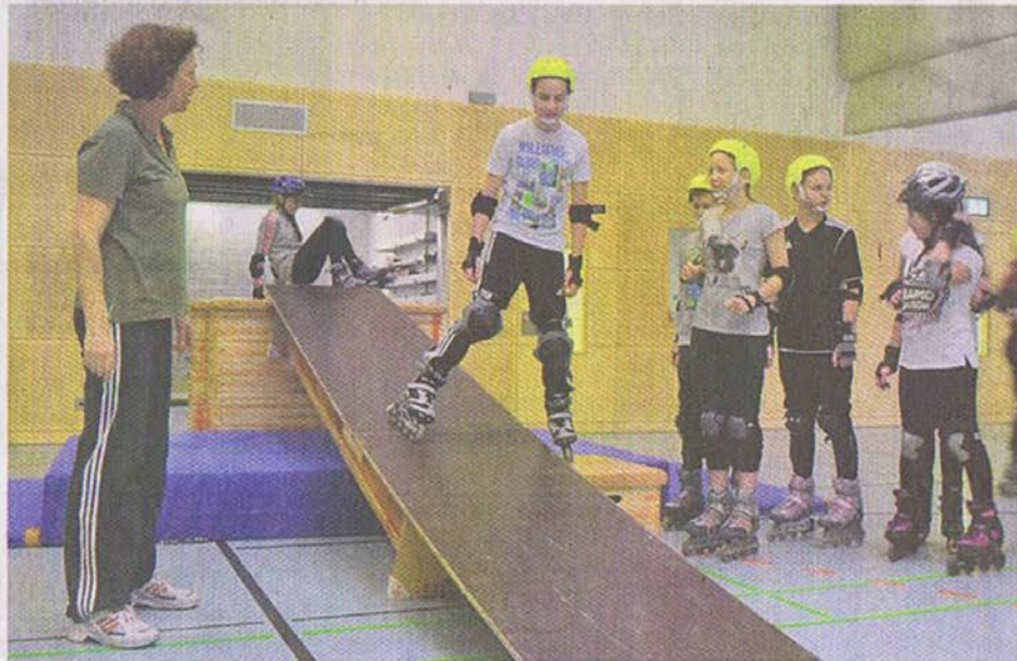
Mit Mut herab: An dieser Rampe wurde der Abfahrtslauf simuliert.

Begleitet von Sportlehrerinnen und Sportlehrern übten die